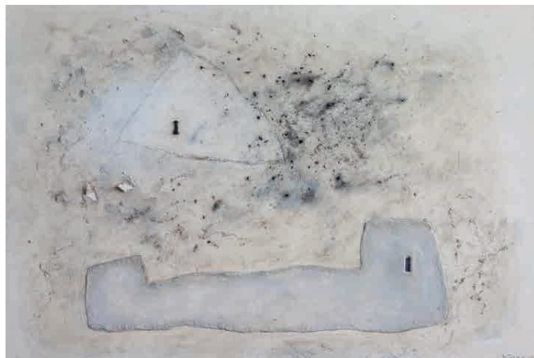
Sen título , 2005