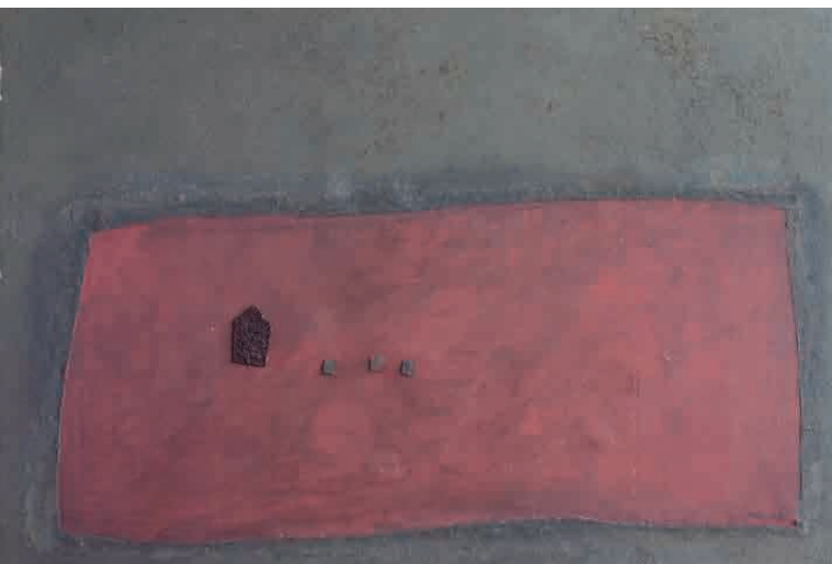
Sen título , 2005