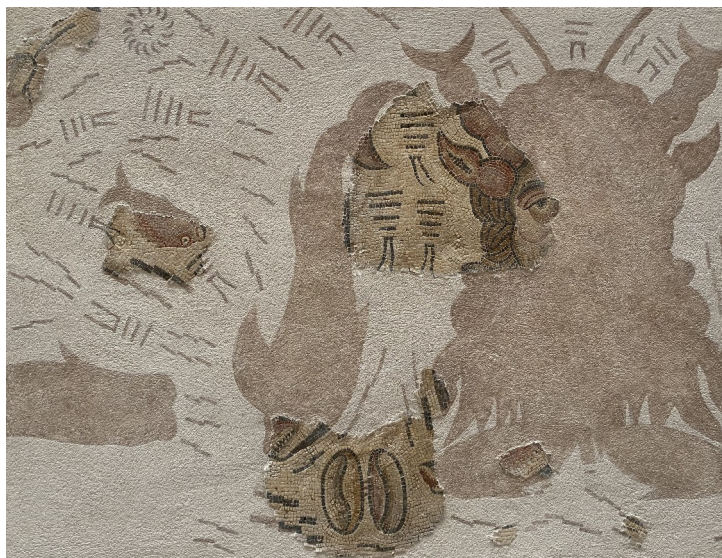
Mosaico romano de Batitales (ss. III-IV d. C.). Procedente da Domus Oceani (Rúa Doutor Castro, Lugo)

Con este pensamento, rematamos mostrando outra representación do océano, neste caso como ser mitolóxico: a figura de Oceanus que protagoniza o mosaico de Batitales, procedente dunha domus romana dos ss. III-VI d. C. Representado con longas barbas e pinzas de crustáceos na cabeza, Océano aparece rodeado de animais mariños para lembrarnos que outrora foi considerado deidade, e que hoxe segue a ser transcendental para o desenvolvemento da vida do ser humano.