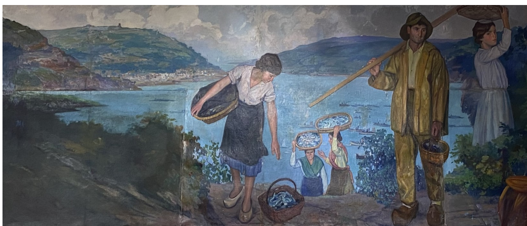
Regreso da pesca (1929). Francisco Lloréns Díaz

Na Biblioteca do MPL expóñense tres frisos, pintados por Francisco Lloréns para a Exposición Iberoamericana de Sevilla (1929), nos que o océano se fai ostensible como fonte de sustento e motor económico: Alegoría da pesca , que presenta a catro homes pescando con redes a carón dun banco de peixes, Regreso da pesca , que mostra a un pescador co seu traxe característico e a catro figuras femininas carrexando o pescado en patelas e Fábrica de sardiñas , no que se representan varias mulleres traballando nunha industria conserveira.