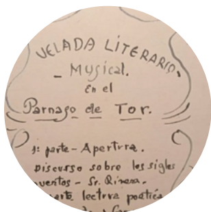
Ornamentos e estilo de liña do Parnaso de Tor