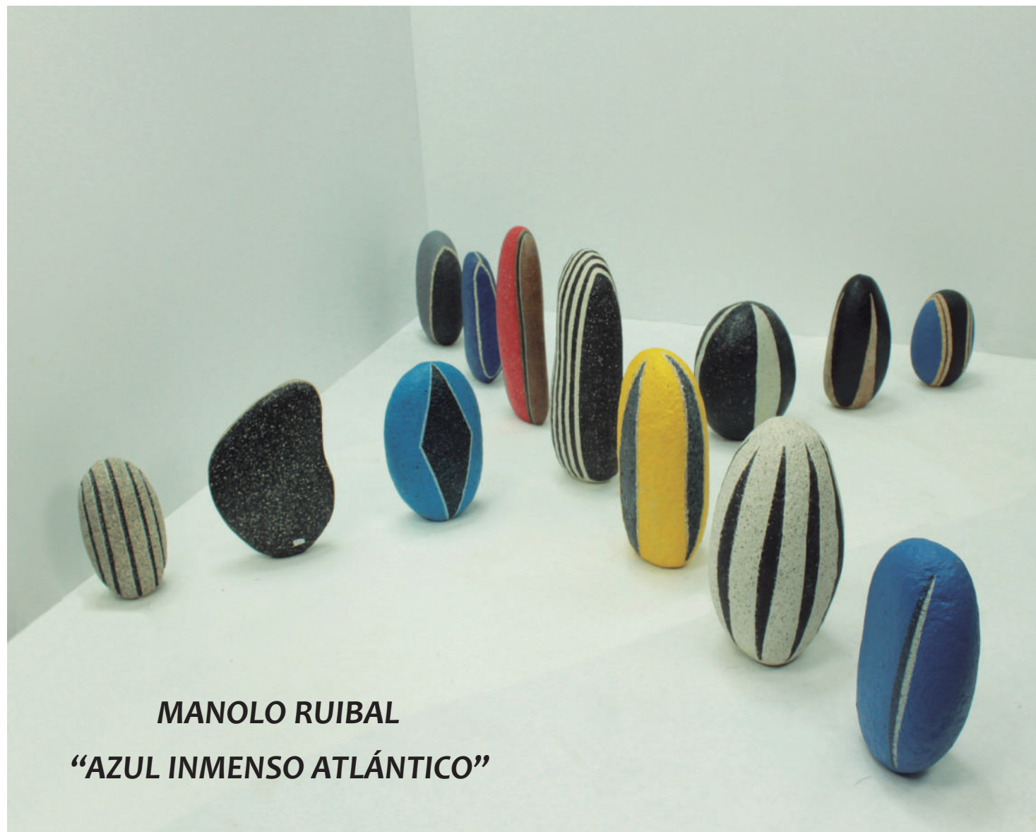
MANOLO RUIBAL "AZUL INMENSO ATLÁNTICO"