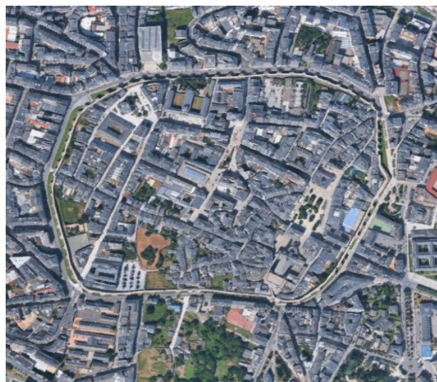
Vista aérea actual da cidade de Lugo

A presenza deste ben cultural é unha constante en calquera imaxe ou representación da nosa cidade, destacando polo seu protagonismo no marco urbanístico desta. É o caso do Plano topográfico da cidade de Lugo (ca. 1812) que se conserva no Arquivo do MPL,