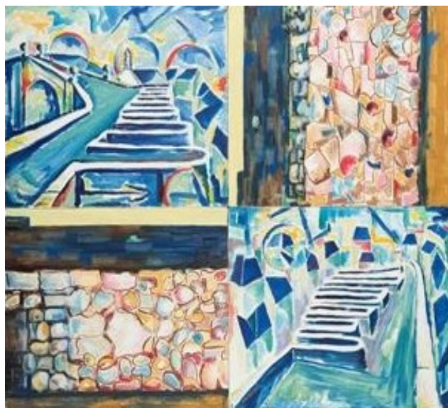
A muralla Blas Lourés