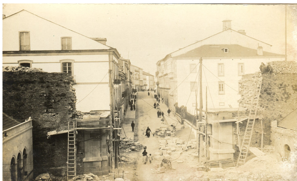
Obras de construción da porta de Emilio Castelar 1919