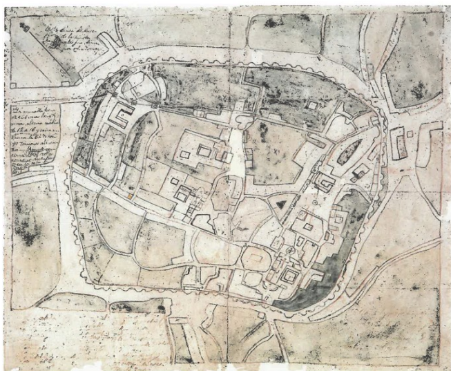
Plano topográfico da cidade de Lugo. Pedro Menchaca e Saturnino Castilla. Ca. 1812 Arquivo do MPL

No marco destas efemérides, desde o Museo Provincial de Lugo lembramos a gran relevancia que a muralla ten para a nosa cidade e para todos os/as lucenses. Por unha banda, o pasado mes de abril organizamos as “VIII Xornadas de divulgación científica do patrimonio arqueolóxico lucense” baixo o epígrafe de “Muralla romana de Lugo: ann XXV in tabula mirabilivm e, por outra, aproveitamos a data do aniversario da súa declaración para dar a coñecer as pezas do museo que, dun xeito ou doutro, gardan relación con ela.