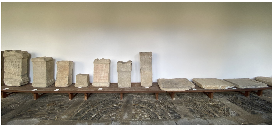
Colección de epigrafía romana procedente da muralla de Lugo Sala 3 (claustro) do MPL

Por último, cabe salientar que o MPL conta cunha importante colección de pezas epigráficas que foron achadas na muralla e nas súas inmediacións. Trátase dun conxunto de aras votivas e placas funerarias que actualmente se expoñen no claustro (sala 3) do museo, testemuñas pétreas do pasado romano de Lugo que a muralla nos lembra, cada día, coa súa presenza.