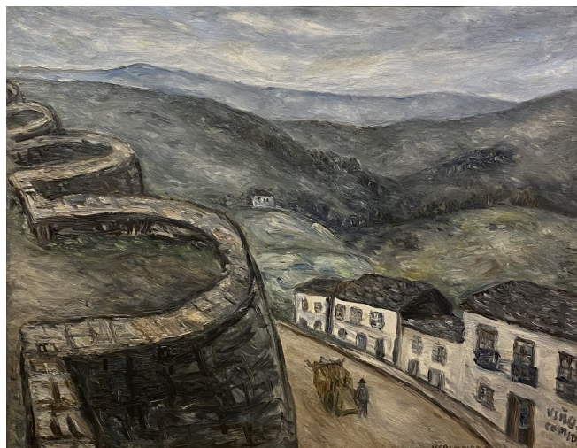
Vista de Lugo con muralla . Manuel Colmeiro. 1934 Sala 14 do MPL

Por outra banda, Blas Lourés elixiu diferentes perspectivas para mostrar a súa estrutura e os seus paramentos na obra A muralla , mentres que Julio Quesada inmortalizou unha vista da cidade desde o seu adarve en Paisaxe urbana de Lugo . Un aspecto que cabe destacar desta pintura é que o artista representou a varias figuras humanas paseando pola muralla, un acto cotián que se repite cada día da man de lucenses e visitantes, evidenciando a súa importancia como espazo habitado pola comunidade da que forma parte.