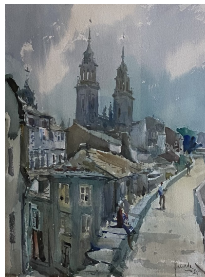
Paisaxe urbana de Lugo