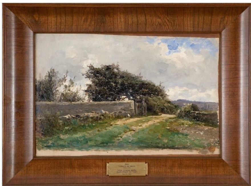
Unha cerca rota (San Juan de Luz)