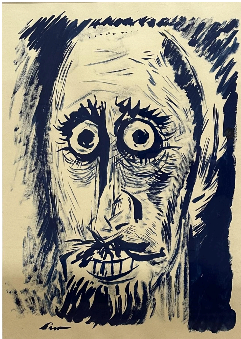
Retrato de Paco Pestana. Témpera sobre papel. 41 x 29 cm

A finais do ano 2017 os museos da Rede Museística Provincial acolleron a mostra SIRO. Restrospectiva, 1970–2017 e no mes de marzo do ano seguinte o propio artista entregou en doazón á Deputación de Lugo, para formar parte dos fondos dos museos da Rede, os retratos de tres significados lucenses, o escultor Paco Pestana (A Frairía, Castroverde, Lugo 1949-Lugo 2021), Celestino Fernández de la Vega (Friol, Lugo 1914-Lugo 1986), escritor, filósofo e ensaísta autor da obra O segredo do humor , un profundo estudo sobre o humor, e Ramón Piñeiro (Armea, Láncara, Lugo 1915-Santiago de Compostela, A Coruña 1990), intelectual e político referente do galeguismo. As tres obras están realizadas coa técnica da témpera sobre papel. Un destes retratos, o de Paco Pestana, consérvase no Museo Provincial.