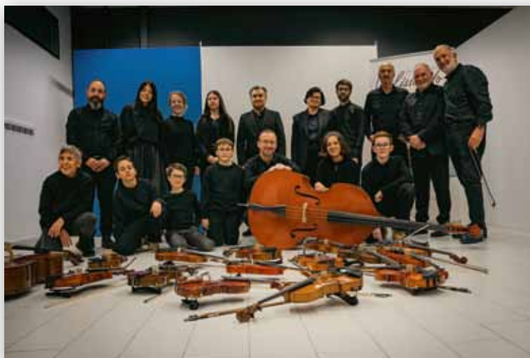
Orquesta de Cámara Lug