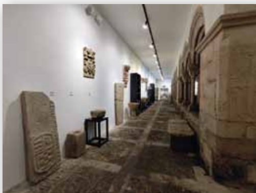
Claustro do Museo Provincial de Lugo (ala oeste)