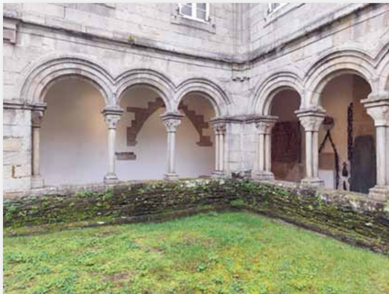
Claustro do Museo Provincial de Lugo (detalle)