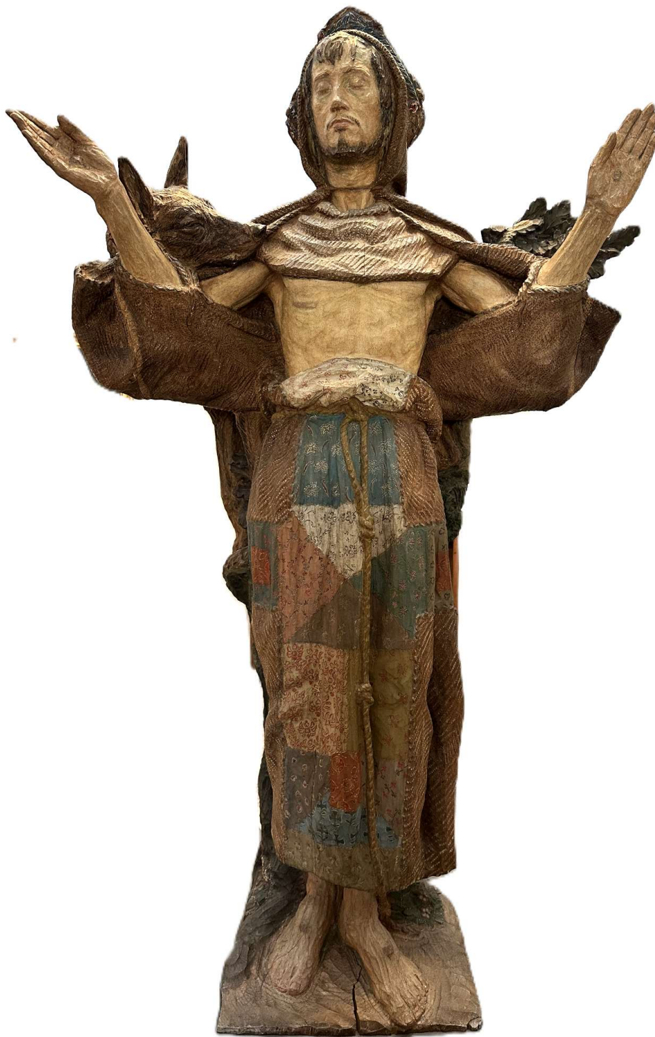
San Francisco. 1926. Francisco Asorey (Cambados, Pontevedra 1889 - Santiago de Compostela 1961)

Madeira policromada. 186 x 109 x 62 cm. Depósito do MNCARS no MPL