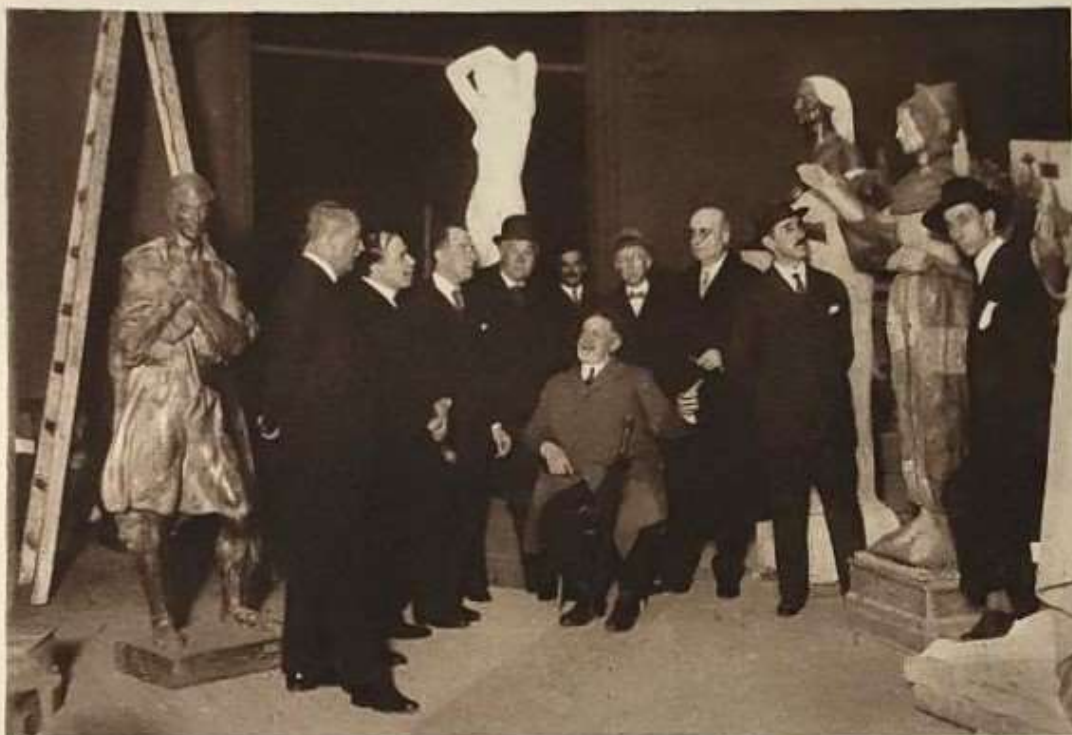
EL JURADO DE ADMISION