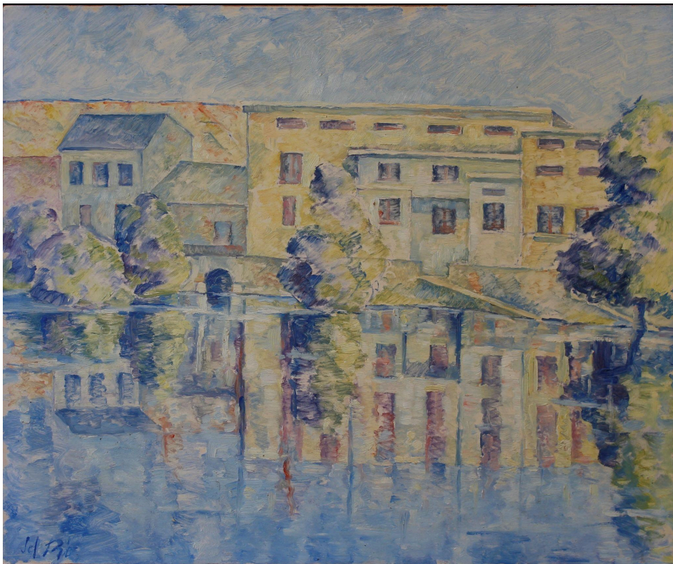
Fábrica de la luz. Lugo. Óleo/táblex. 54x65 cm