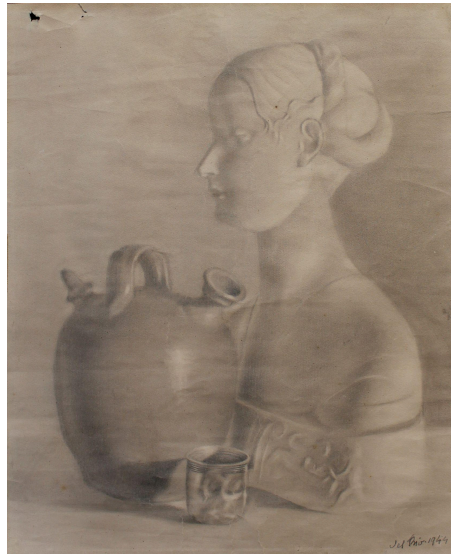
Figura de muller con porrón. 1944. Carbón/papel. 50,8 x 41,8 cm

A colección de debuxos pertence maiormente á súa etapa en Francia. Trátase de bosquexos tomados do natural de distintos lugares de París e arredores, de Niza e da emblemática montaña Sainte-Victoire ao sur do país, nas proximidades de Aix-en-Provence, lugar de nacemento e morte de Cézanne. Tamén forma parte da colección un debuxo a carboncillo datado en 1944 que representa unha composición cun porrón, un vaso e unha peza escultórica, un busto de muller renacentista, seguramente de escaiola, unha proposta característica de etapas de aprendizaxe en academias e escolas de arte para valorar volumes, luces e sombras e representar o aspecto de diferentes materiais.