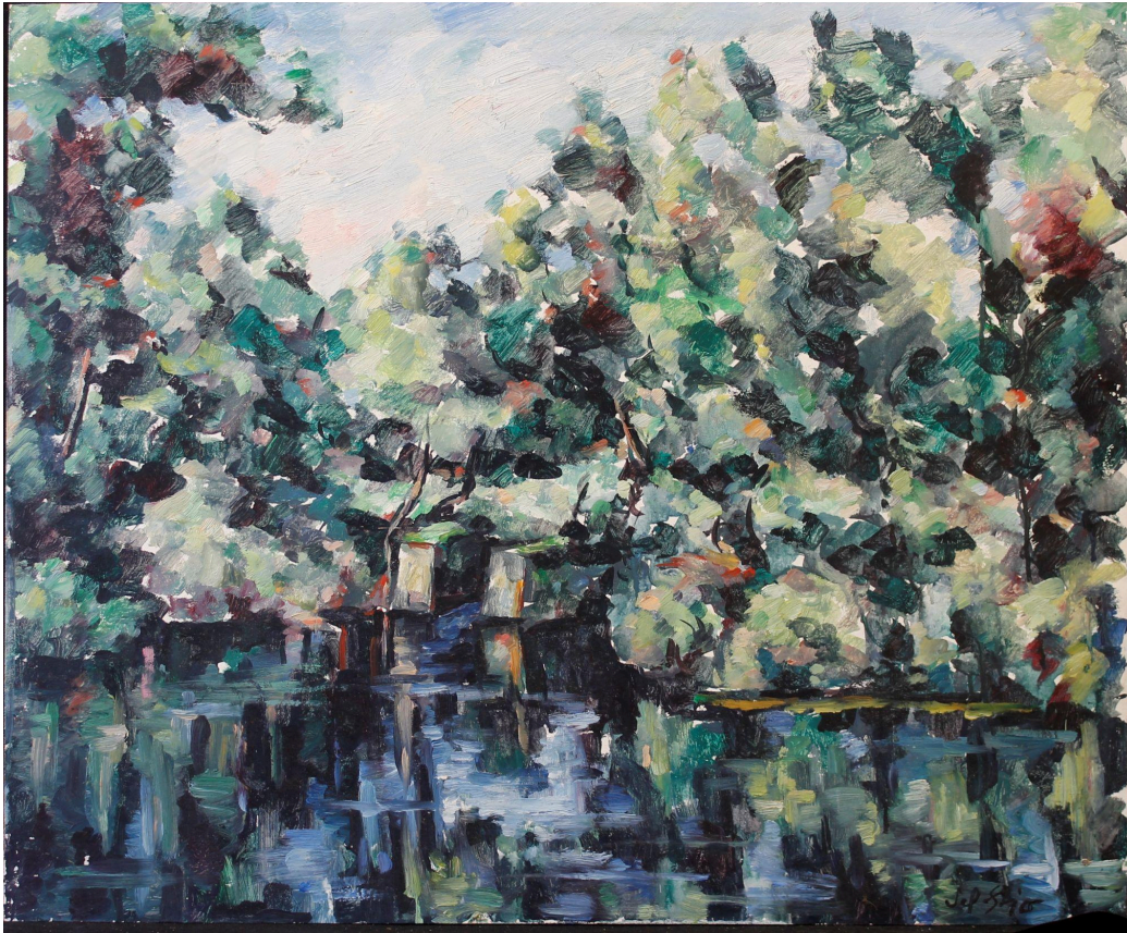
S/T. Óleo/táblex. 1976. 60x73 cm