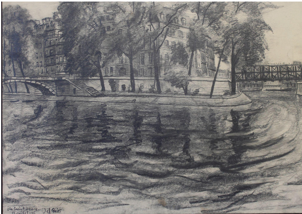
Île Saint-Louis. Paris. 1956. Grafito/papel. 36,6 x 51,3 cm