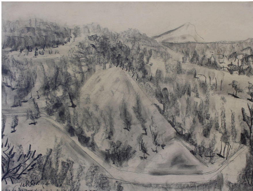
Aix en Provence. Montagne Sainte-Victoire. 1956. Grafito/papel. 36x48,8 cm