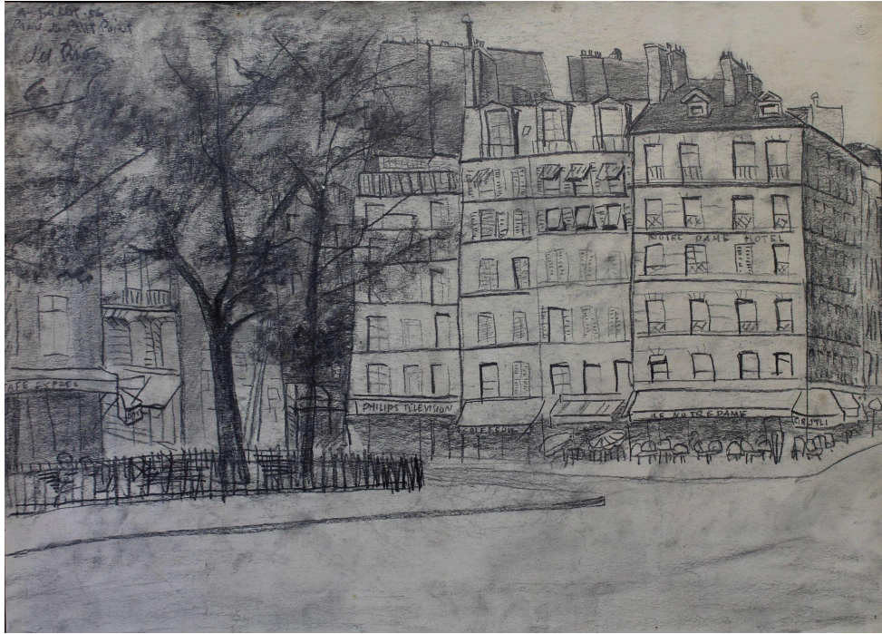
Place du Petit-Pont. 1956. Grafito/papel. 36,7 x 51,2 cm