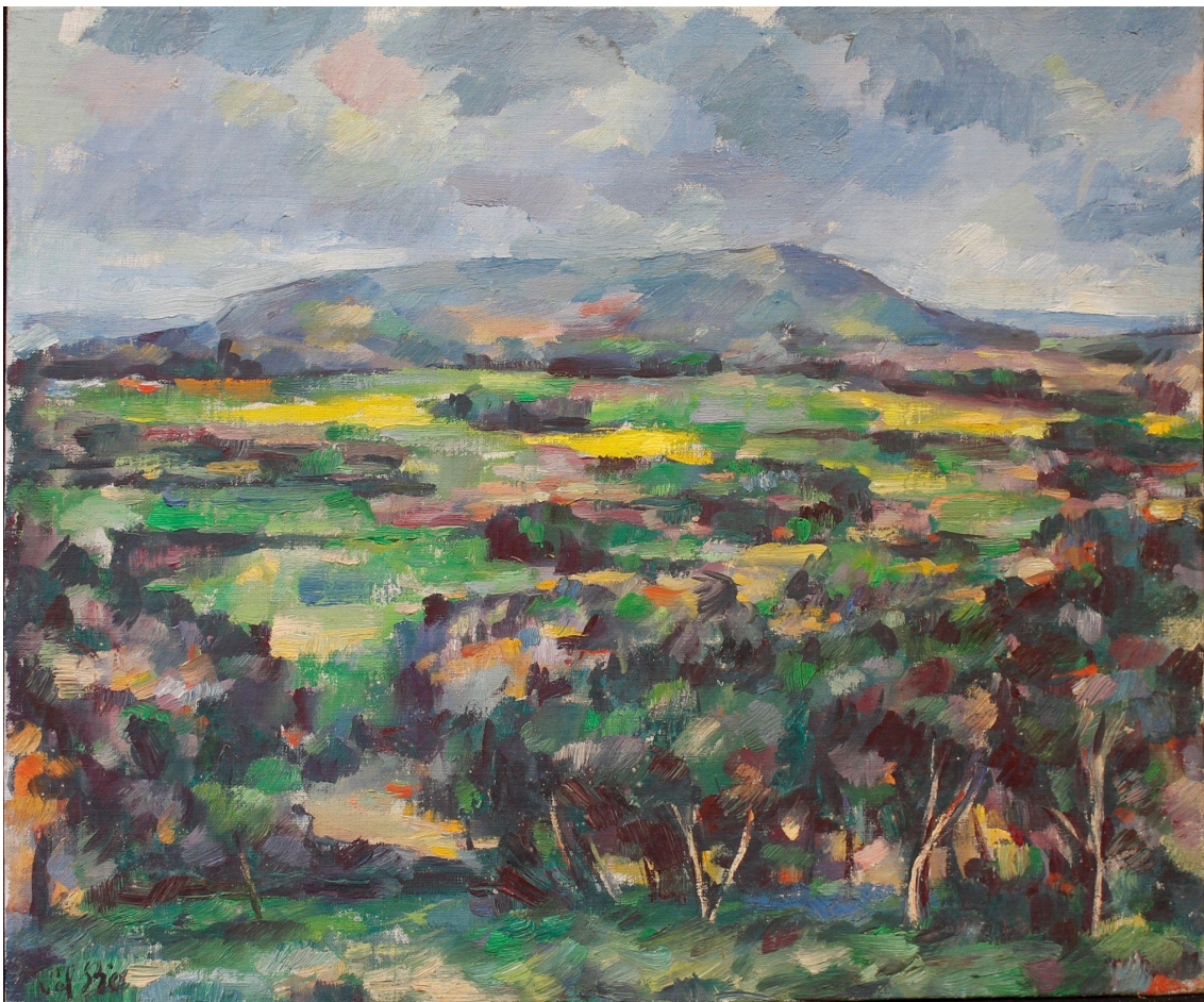
S/T. Óleo/táblex. 38x46 cm

El conjunto de obras nos muestra la evolución artística, las características técnicas y de estilo. Entre las pinturas predominan los paisajes, pero también tenemos ejemplos de naturalezas muertas, algunas de primera época, incluso de su etapa de formación, y el retrato de un familiar, ámbito en el que solía encontrar a sus modelos.