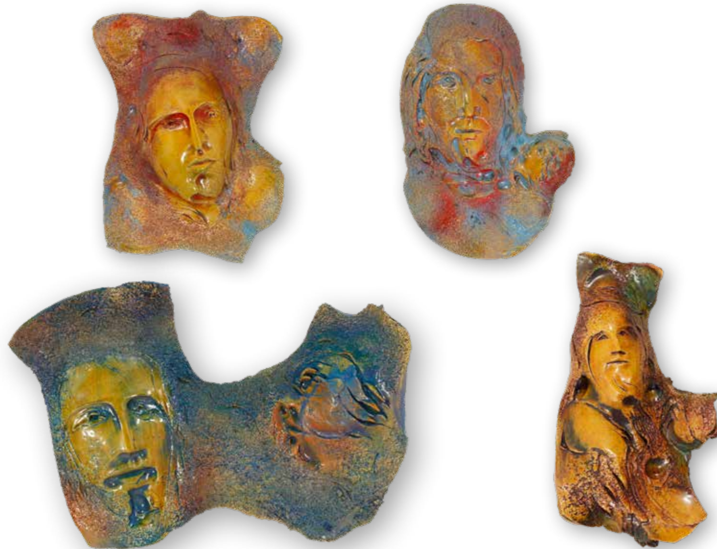
Variancións sobre a Virxe dos Ollos Grandes

Coa presente versión contemporánea da venerada patroa de Lugo, inspiradora desta serie realizada ad hoc para o Museo Provincial de Lugo, rememora outras propostas vangardistas executadas nos difíciles anos da Ditadura cando a arte dos ar-